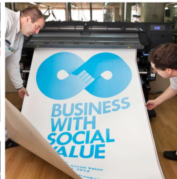
Digital gran formato