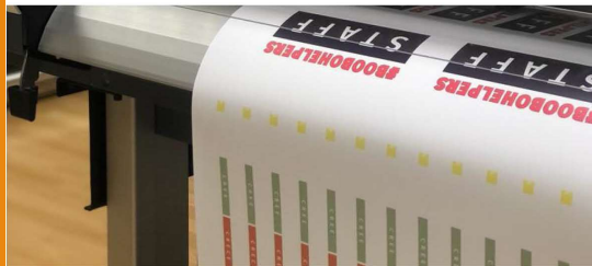
Plóter impresión y corte