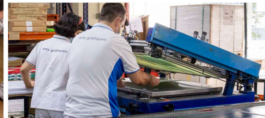
Serigrafía plana y cilíndrica