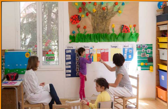
ESCUELA DE EDUCACIÓN ESPECIAL TAIGA

Nuestra Fundación proporciona su apoyo principalmente a los centros que se fueron creando desde la organización operativa