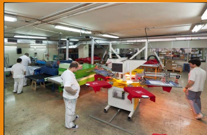
CENTRO ESPECIAL DE EMPLEO: ICARIA GRÁFICAS